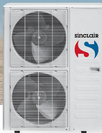
ASE-48AH / ASE-60AH